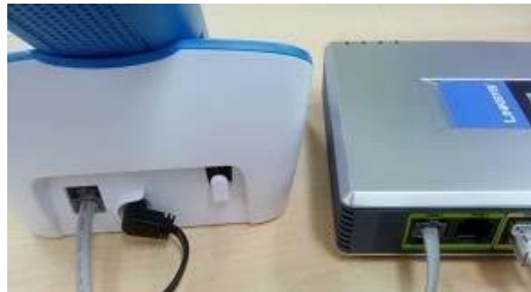
另一端接連電話機