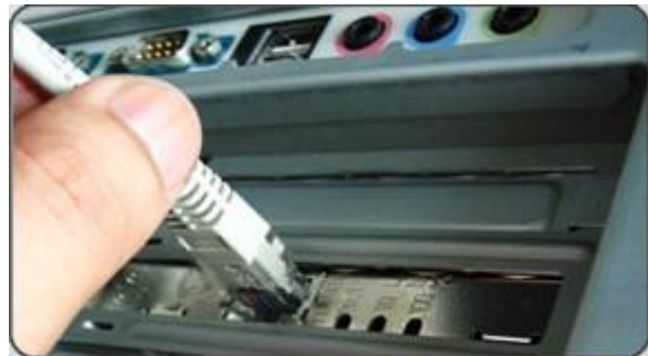
插入 RJ45 連接線