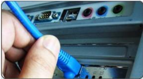
於電腦拔出以太網線

其後，在電腦關閉的情況下，直接將原本連接電腦的以太網線拔出，並將它連接至寬頻電話盒背後的 INTERNET 埠。