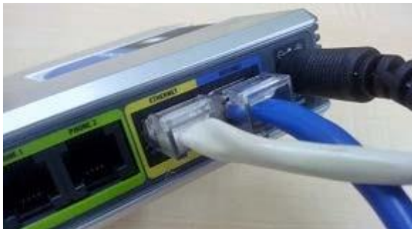
另一端接連 ETHERNET 埠

接駁電腦時，將一條 RJ45 連接線連接至寬頻電話盒背後的 ETHERNET 埠，而另一端則連接至於步驟二拔出之 PC ETHERNET 埠。