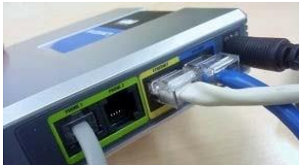
將電話線插入 PHONE 1 埠

最後，只需將電話線連接至寬頻電話盒背後的 PHONE 1 埠，而另一端則連接至家居電話的電話線埠便可。