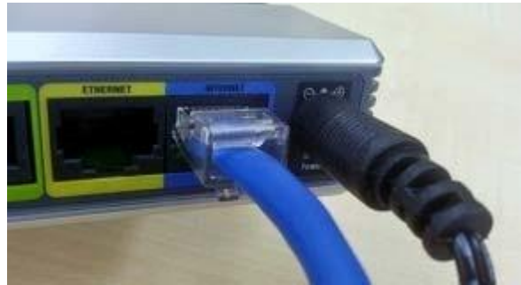
將之插入 INTERNET 埠